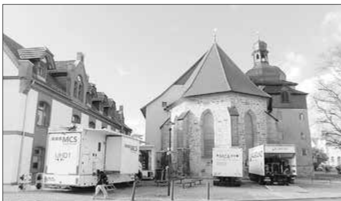
Technik (einschließlich Stromversorgung) vor der Kirchenapsis

Am Tag vor der Sendung positionierte sich die gesamte Technik vor und in der Kirche, selbst eine eigene Stromversorgung stand bereit.