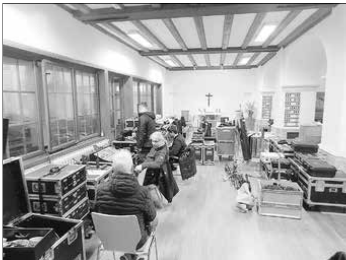
Gemeindesaal als „Schaltzentrale“

Der Gemeindesaal etablierte sich zur Schaltzentrale.