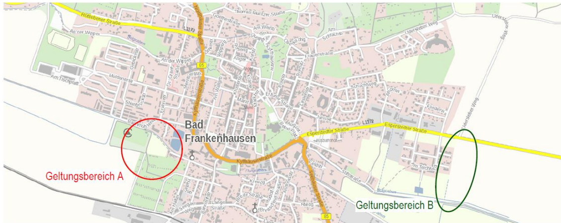
Darstellung ohne Maßstab