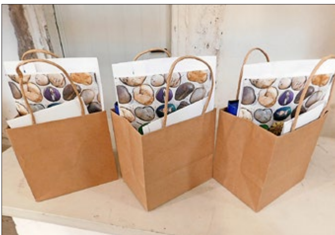
Geschenke für die Konfirmanden