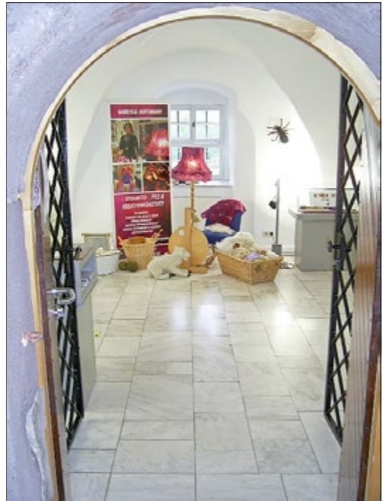
Die Türen sind weit geöffnet