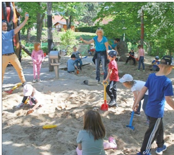
Die Sonne lachte vom Himmel und so ließen alle Kindervilla-Kinder gemeinsam viele bunte Luftballons in den Himmel steigen. Diese hatten sie zuvor mit ihren Wünschen bestückt. Und die waren, wie die Kinder, sehr vielfältig. Manche Kinder wünschen sich neues Spielzeug, andere ein Haustier, aber einige Kinder wünschen sich auch, dass die Mama nicht mehr so lange arbeiten muss oder dass Corona endlich vorbei ist.