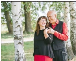
Duo „ con emozione “

Sie sind im Regionalmuseum keine Unbekannten. In jedem Jahr eröffnen Sie die Veranstaltungen im Museum mit Ihrem Neujahrskonzert, dieses musste wegen bekannter Umstände nun schon zum 2. Mal verschoben werden. Der neue Termin ist der Samstag, 2. Oktober 2021.