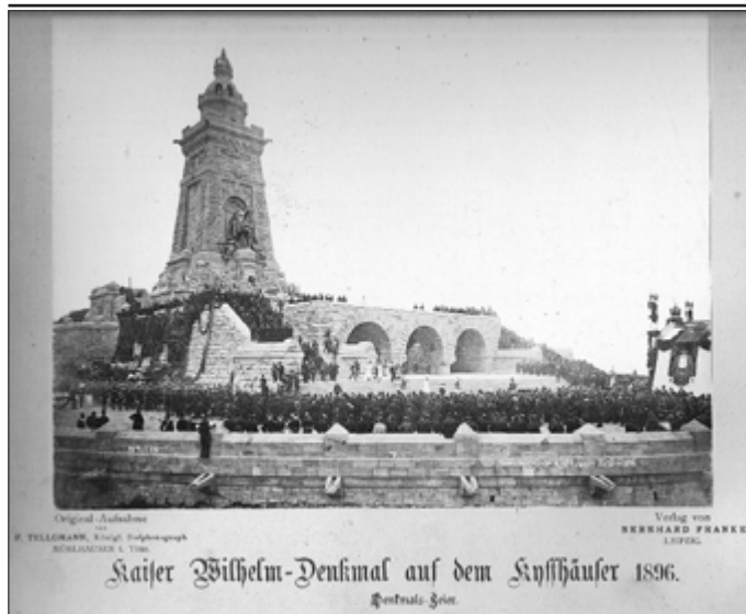
Kaiser-Wilhelm-Denkmal Einweihung 18.6.1896

Sagenumwoben, von den Mysterien der altgermanischen Götterwelt durchsetzt, erhebt sich das Kyffhäusergebirge aus den umgebenden Auen, der Goldenen im Norden sowie der Diamantenen im Süden. Der Kyffhäuser, in seiner Fläche als das kleinste Mittelgebirge Deutschlands bekannt, entwickelte sich im Laufe der Geschichte, zu prägender Größe. Das ewige Verlangen nach Einigkeit und Frieden durchzieht seit Anbeginn mythologisch den Berg. So war der Kyffhäuserberg einst heidnischer Kultort, auf dessen Bergkamm einst Göttervater Wodan verehrt wurde, unsichtbar in graue Nebelschleier verborgen, einem Hut gleich, so der Volksglaube. Jahrhunderte später war es dann Kaiser Friedrich, der Friedensbringer der Christenheit, der dem Gebirge seine Aura verlieh. Der Prophezeiung nach, sollte der Sagen-Kaiser dann am Jüngsten Tage, auf dem Rathsfelde die letzte Weltenschlacht führen und dadurch das Heilige Grab zurückgewinnen. Nach gewonnener Schlacht hängt er sein Schild an einen dort stehenden dürren Baum. Dieser treibt wieder aus und eine friedliche Welt wird entstehen.