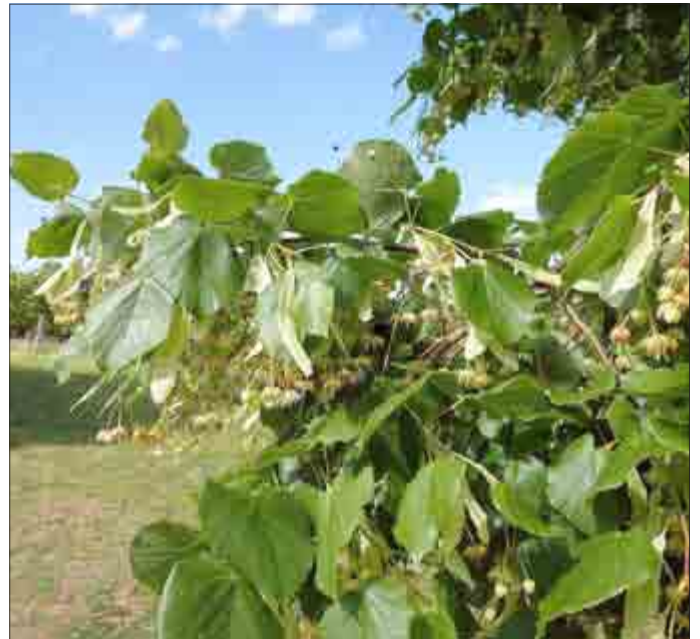
Lindenblüten auf der Heide in Udersleben

Genießen Sie die Lindenblüten „...mit ihrem Duft – berauschend schön.“, diese blühen Trotz allem.