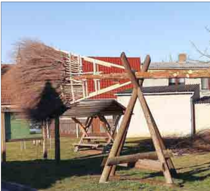
Der unfertige neue „Jubiläumsbesen“

Leider muss auch dieses Fest auf Grund der CORONA-Pandemie abgesagt werden!