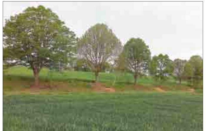
Die Linden entlang der Weißen Straße in Richtung Rathsfeld

Gerade wurden einige Alleen durch die Mitarbeiter der Naturparkverwaltung Kyffhäuser einer fachgerechten „Baumkosmetik“ unterzogen