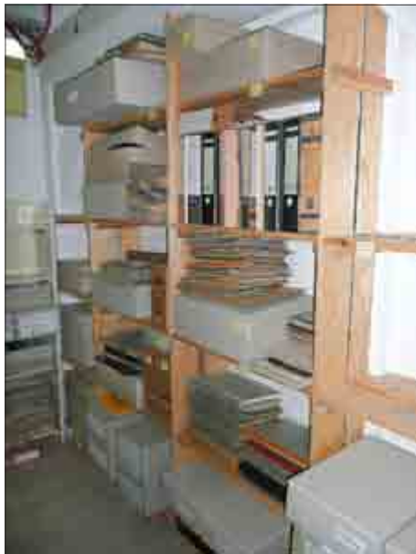
Blick in das Dokumentenarchiv des Regionalmuseums

Die Museumsarbeit vor den Kulissen ist zwar der für die Öffentlichkeit sichtbare Teil. Außerhalb der Ausstellungen wartet der Hauptanteil der Museumsaufgaben.