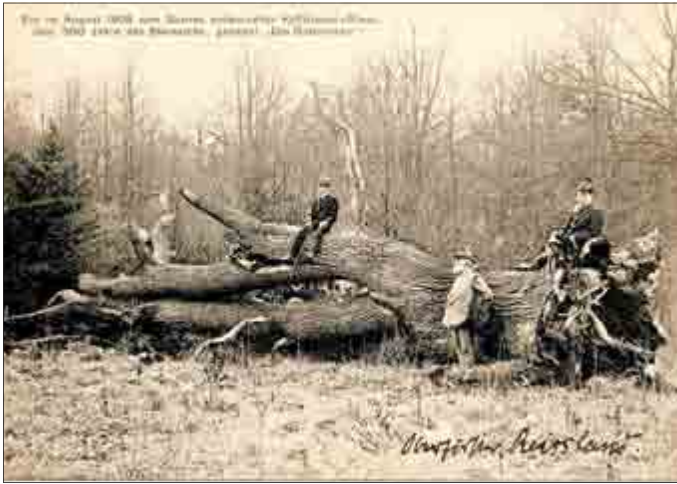
Entwurzelte Steineiche im Kyffhäusergebirge. Postkarte 1908

Der nun folgenden Fotografie hängt eine gewisse Denkwürdigkeit an. Sie zeigt eine der Zusammenkünfte aller Förster und Jäger im Dienste des Landes Schwarzburg-Rudolstadt. Das Treffen fand kurz vor Ausbruch des Ersten Weltkrieges im Hotel und Gasthaus „Burghof zum Kyffhäuser“ unterhalb des „Kaiser-Wilhelm-Denkmal“ statt. Die eher seltenen Treffen wurden organisiert, damit sich die Forstbediensteten des Fürstentums kennenlernen und austauschen konnten. Für ein territorial in drei wesentliche Teile - Oberherrschaft Rudolstadt mit dem abgetrennten Amt Leutenberg und Unterherrschaft / Amt / Kreis Frankenhausen - getrenntes Land wie Schwarzburg-Rudolstadt, war es nicht einfach, den Zusammenhalt zu wahren. Viel zu verschieden war und ist heute noch die Mentalität zwischen den Menschen in den Kammlagen des Thüringer Waldes, nahe Franken, und denjenigen zwischen Kyffhäuser und Hainleite. Die Lebensgeschichte von Karl Reißland spiegelt dies anschaulich wieder. Immer wieder wurde er innerhalb des Fürstentums Schwarzburg-Rudolstadt versetzt. Die Gründung einer Familie war ihm zeitweilig untersagt. Erst im fortgeschrittenen Alter war ihm die Heirat möglich. Da war der kleine Max Daniel Hermann schon einige Jahre alt und bei seiner Mutter in Neuhaus am Rennweg verblieben. Leider ist uns heute nicht bekannt, ob sich Vater und Sohn gut kannten.