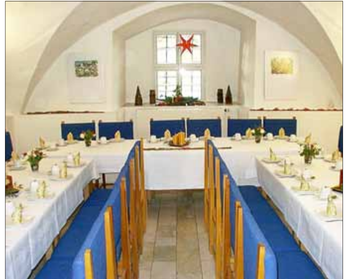
Blick in die Räume

Sie können uns telefonisch unter 62086 erreichen.