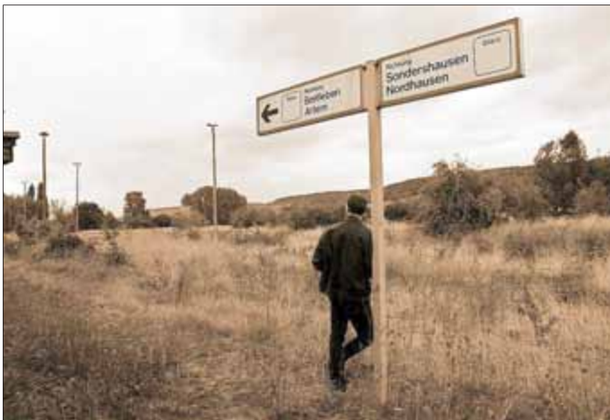
„Warten auf den Zug im Stil der 1980er Jahre (sepia) September 2018, Bahnhof Bad Frankenhausen“ (Foto Teresa Küster)

Fotos von Teresa Küster, Bad Frankenhausen am Mittwoch, dem 19. Juni 2019, um 19.00 Uhr