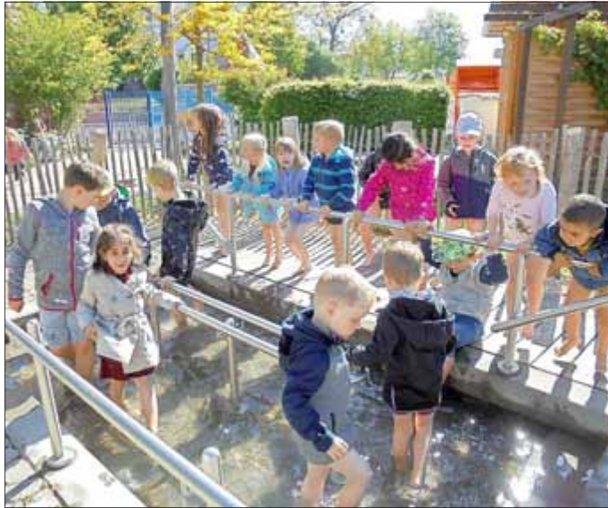
Das Team „Sonnenschein“ und die Sonnenscheinchen

rege genutzt wurde. Hierfür auch ein herzliches Dankeschön an das Team für die wunderbare Vorbereitung. Eine gelungene Woche ging zu Ende.