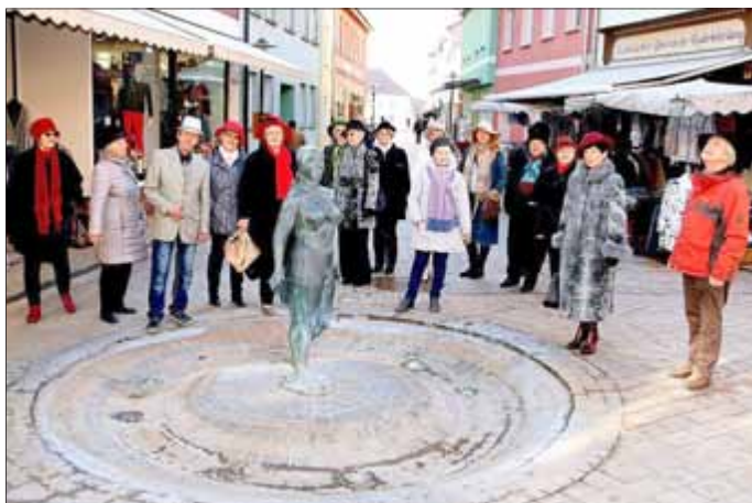
Gut behütet! - Flanieren Frauen und Männer durch die Kräme