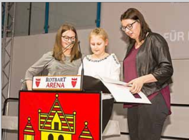
Durch das Programm führten traditionsgemäß Vertreter des Kinder- und Jugendstadtrates

Bereits zum 13. Mal fand am Abend des 08. März in Bad Frankenhausen die Ehrenamts-Gala der Stadt Bad Frankenhausen statt. Es war die erste Veranstaltung der Stadt in den neuen Räumen der Rotbart-Arena.