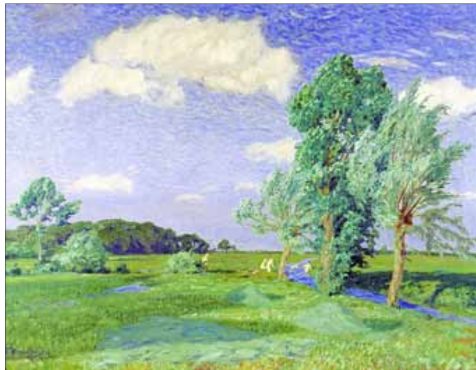
Sommerzeit II oder Badende Jungen an der Aue, 1908; Öl auf Leinwand, 95 x 125 cm; Overbeck-Museum Bremen

Mit einer großangelegten Retrospektive feiert das Panorama Museum Bad Frankenhausen den 150. Geburtstag von Fritz Overbeck (1869-1909). In enger Zusammenarbeit mit dem Overbeck-Museum in Bremen werden 50 Gemälde und 60 Zeichnungen, Aquarelle und Radierungen präsentiert, die den Betrachter mitnehmen auf eine Reise, die Lebensreise von Fritz Overbeck.