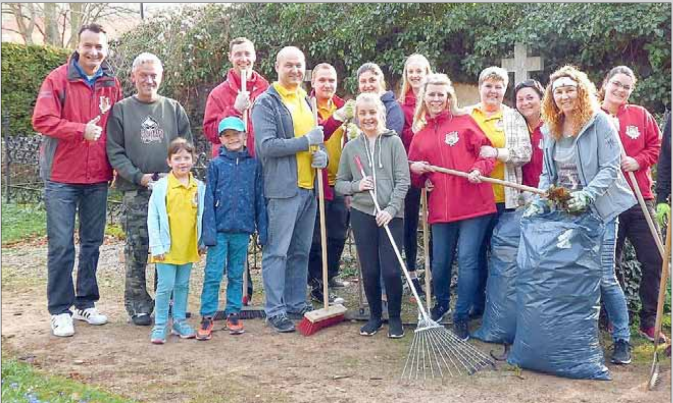
Frühjahrsputz im Botanischen Garten 2017

Alle Bürgerrinnen und Bürger, Vereine, Gewerbetreibenden, Betriebe, Parteien, Schulen, Institutionen und Kindereinrichtungen aus Bad Frankenhausen und den Ortsteilen Esperstedt, Seehausen, Ichstedt, Ringleben und Udersleben sind aufgerufen, sich am diesjährigen Frühjahrsputz am