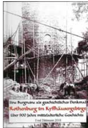
Einband - Titelblatt von Fred Dittmann

Eine der interessantesten Burgen im Kyffhäusergebirge ist die Rothenburg. Über ihre wechselvolle 900 jährige Geschichte berichtet Fred Dittmann aus Kelbra in seinem neuen Buch. Etwa um 1100 erstmals datiert entstand auf dem nördlichen Bergsporn des Kyffhäusergebirges die Burganlage, die im Laufe der Jahrhunderte ihr Aussehen veränderte. Das Baumaterial, der rote Kyffhäusersandstein, ist wahrscheinlich auch der Namensgeber der Burg und des zunächst dort ansässigen Grafengeschlechtes.