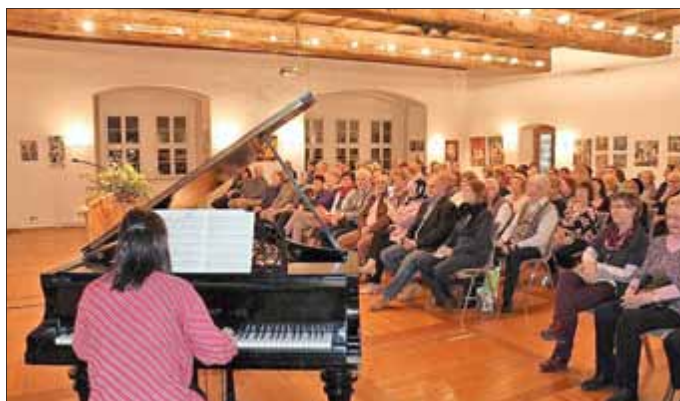
Blick in den Festsaal