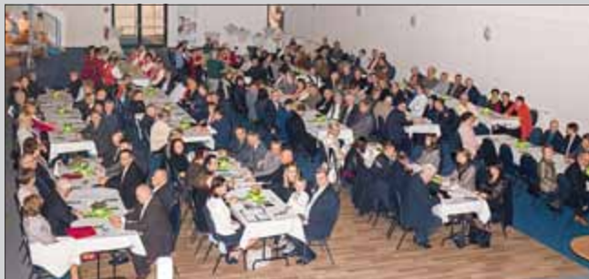
Über 200 geladene Bürgerinnen und Bürger waren zur Festveranstaltung anwesend

Bereits zum 13. Mal fand am Abend des 08. März in Bad Frankenhausen die Ehrenamts-Gala der Stadt Bad Frankenhausen statt. Es war die erste Veranstaltung der Stadt in den neuen Räumen der Rotbart-Arena.