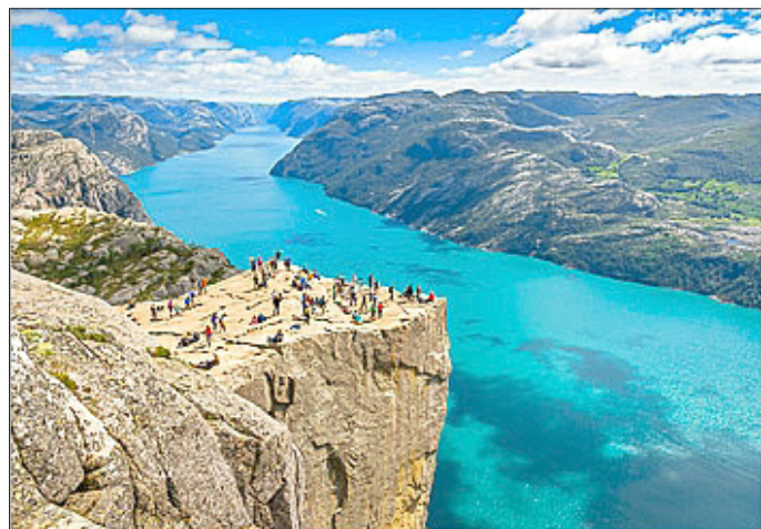
Felsen Preikestolen am Lysefjord

Reiseshow zeigt das Land der Mitternachtssonne am Freitag, den 16. Februar 2018 in Bad Frankenhausen