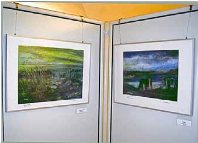
Blick in die Ausstellung

„Befreiung der Seele“ - Malerei und Grafik von Rudolf Will, Saalfeld Die Ausstellung ist von Mittwoch bis Sonntag von 10.00 bis 17.00 Uhr zu besichtigen.