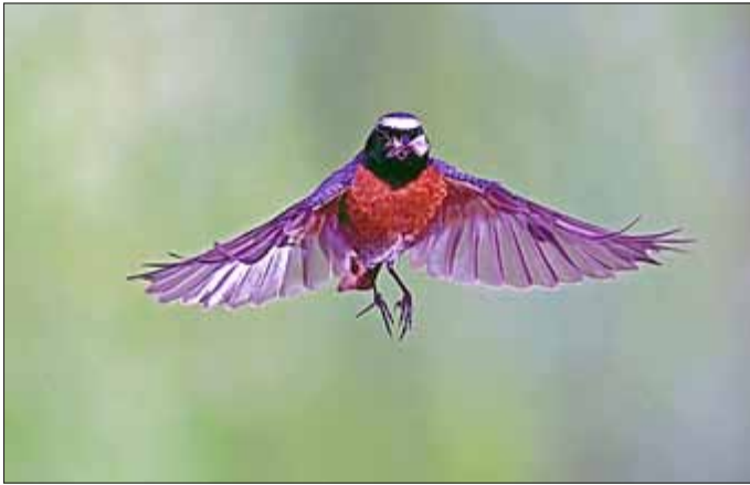
Christoph Franz Robiller: Gartenrotschwanz, Deutschland, Weimar, 6. Juni 2010

Bleibt zu wünschen, dass viele Gäste den Weg ins Museum finden, um diese einzigartigen Bilder zu sehen. Denn auch an heißen Sommertagen, versprechen die dicken Mauern des Schlosses eine Abkühlung gespickt mit tollen sehens- und wissenswerten Ausstellungen. Diese Sonderausstellung ist eine Kooperation mit dem „Verein der Freunde und Förderer des Naturkundemuseums Erfurt e.V.“ und kann bis zum 27. August 2017 zu den Öffnungszeiten Mittwoch bis Sonntag von 10.00 bis 17.00 Uhr besichtigt werden.