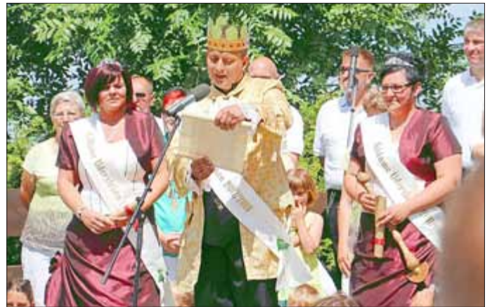
Die Stücke der Einmarschmusik wurden fast zweimal durchgespielt, dann endlich - Motoren und große Fahrzeuge am Horizont. Mit einer Schlepperskorte erreichte ein riesiges Fahrzeug den Festplatz aus dem der neue Laubkönig entstieg. Aus dem Anhänger stiegen die Hofdamen. Jetzt konnte die Krönung beginnen.