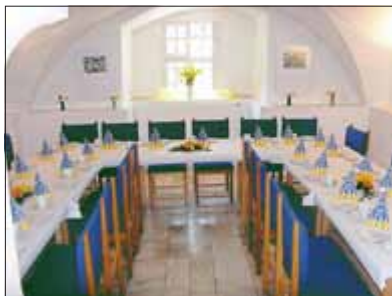
Gewölbe aus dem 16. Jahrhundert