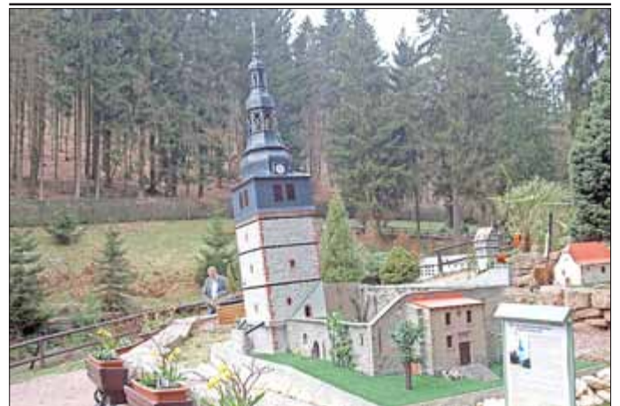
Oberkirche im Mini a Thür Ruhla

Aus diesem Anlass mietet der Förderverein Oberkirche Bad Frankenhausen e.V. bei einem renommierten Busunternehmen einen modernen Reisebus (mit Fahrer) und Sie fahren ganz bequem von Bad Frankenhausen zum Mini a Thür nach Ruhla, in unmittelbarer Nähe zum Rennsteig. Das Gelände ist 18.000 qm groß.