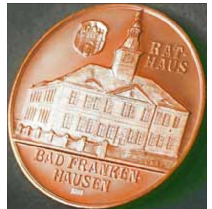
Auszeichnungsmedaille „In Anerkennung hervorragender Leistungen“

Zum 65. Jubiläum des damaligen Kreisheimatmuseums, heute Regionalmuseum, entstand eine Medaille. Zum 500. Geburtstag von Thomas Müntzer, welcher 1989 in einem Jubiläumsjahr begangen wurde, entstanden zahlreiche Medaillen.