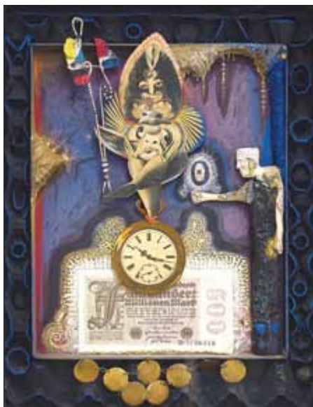
Bild: Winkler - Und ein Morgen wird nicht mehr sein, (1966) Assemblage aus Papier, Geldschein, Stoff, Draht, Knochen, Holz, Stein, Münzen, Pappe im Fotokarton im verglasten Objektkasten 44,0 x 34,5 x 5,5 cm (Woldemar-Winkler-Stiftung der Sparkasse Gütersloh)

Mehr als achtzig Jahre währte das Wirken von Woldemar Winkler (1902-2004). Der vielseitige Künstler hinterließ eine Fülle an Zeichnungen, Collagen, Assemblagen, Aquarellen, Druckgrafiken und Gemälden, die sich zwischen Neuer Sachlichkeit, Spätimpressionismus, Surrealismus, Informel und der fantastischen Kunst bewegen. In einer groß angelegten Retrospektive präsentiert das Panorama Museum neunzig Arbeiten aus der gesamten Schaffenszeit des Künstlers.