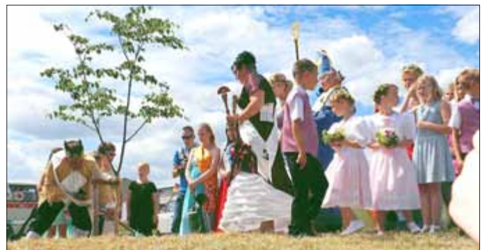
Nach der feierlichen Krönung ging die Festgesellschaft zum Pflanzen des Lindenbaumes.