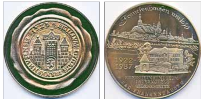
Medaille zum „65. Jährigen Bestehen des Kreisheimatmuseums Bad Frankenhausen“

Der Fachgruppe ist es auch zu verdanken, dass zahlreiche Medaillen aus der Hand von Helmut König zu Frankenhäuser Themen und Ereignissen entstanden.