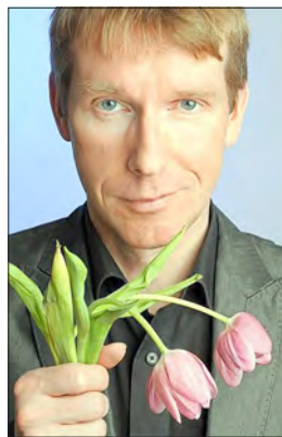
Vollmer „Männer verduften“

Karten für diesen Abend erhalten Sie an der Museumskasse oder telefonisch unter 034671/62086 und museum@bad-frankenhausen.de (VVK 15,00 € / Abendkasse 16,00 €)