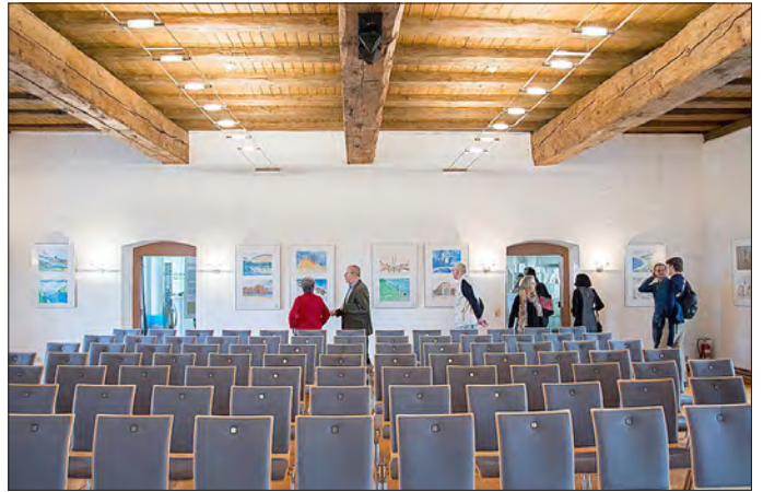
Blick in den Ausstellungsbereich im Festsaal

Lassen Sie sich überraschen und folgen Sie den „WEGZEICHEN“ von Armin Graßl.