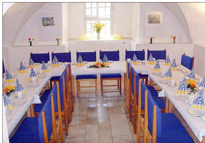
Gewölbe aus dem 16. Jahrhundert

Für Ihre Anmeldung können Sie uns unter 034671/ 6 20 86 erreichen.