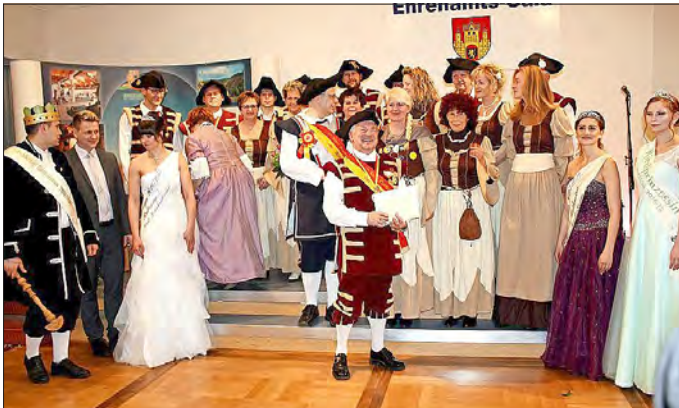
Frankenhäuser Hoheiten, Bürgermeister, Hausmänner mit ihren Marketenderinnen