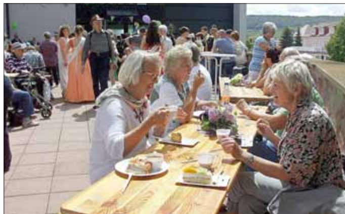
Impressionen vom Hoheitentreffen auf der Schlossterrasse aus dem Jahr 2016

Für das leibliche Wohl sorgen das Regionalmuseum und der Heimat- und Museumsverein Bad Frankenhausen e.V. mit leckerem Kaffee und Kuchen aus der Schloßküche zur königlichen Kaffeemeile.