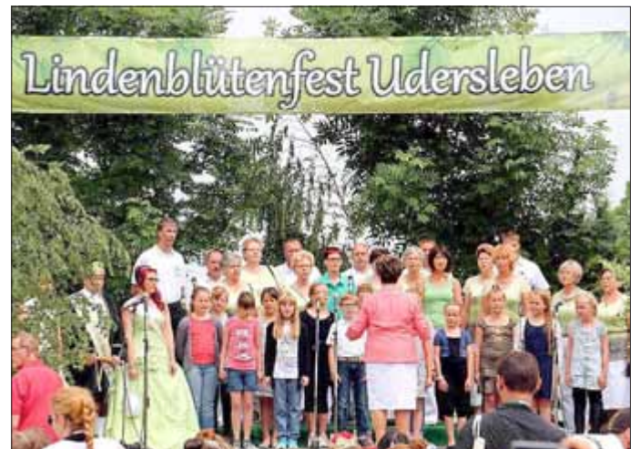
Impressionen vom Lindenblütenfest 2016

Zum Fest laden die Uderslebener wieder Gäste aus nah und fern, im Duft der Lindenblüten ein dreitägiges Fest zu feiern.