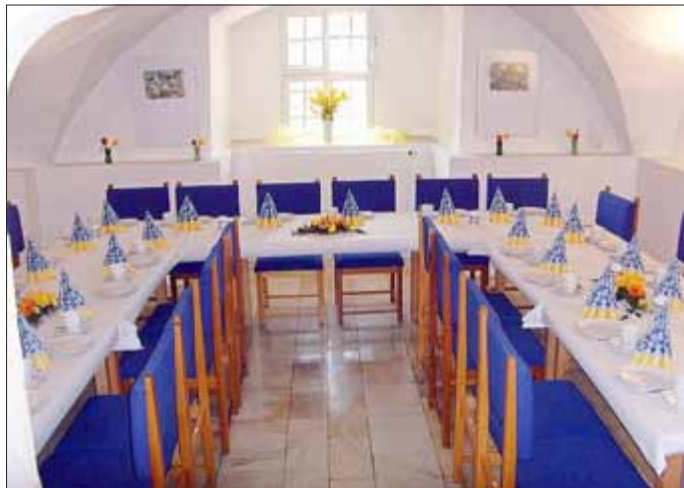
Gewölbe aus dem 16. Jahrhundert