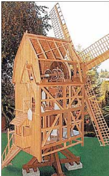
Modell einer Windmühle, © Joachim Rotzoll