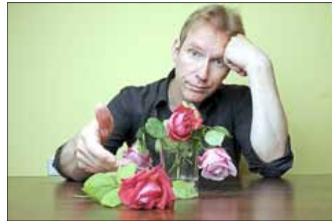
Vollmer Männer verduften

Karten für diesen Abend erhalten Sie an der Museumskasse oder telefonisch unter 034671/62086 und museum@bad-frankenhausen.de (VVK 15,00 € / Abendkasse 16,00 €)