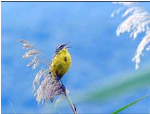
Schafstelze im Seehäuser Ried

Das Esperstedter Ried in Nordthüringen gehört zu den bedeutendsten Binnensalzstellen Deutschlands und ist schon seit historischen Zeiten ein klassisches Exkursionsziel für Botaniker und Zoologen. Die weiträumigen Wiesenkomplexe mit Feuchtbereichen, Röhrichten und Grabensystemen sind darüber hinaus einzigartige Refugien für bedrohte Vogelarten, aber auch für zahlreiche Wirbellose.