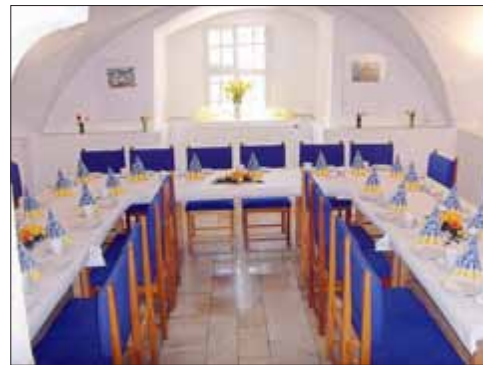
Gewölbe aus dem 16. Jahrhundert

Für Ihre Anmeldung können Sie uns unter 034671/ 6 20 86 erreichen.