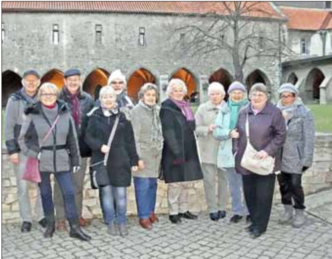
vor dem Kreuzgang am Dom

Es müssen nicht immer neue Wege sein, man kann auch alte neu entdecken!!