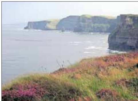
Cliffs of Moher in Irland

Glücklicherweise verfügen sowohl Irland als auch Schottland noch heute über eine sehr aktive Singer-Songwriter Szene, so dass Sie sich auch von Liedern neueren Datums verzaubern lassen können. Denn eins steht fest: Diese Melodien fesseln, ergreifen und lassen einen so schnell nicht wieder los!