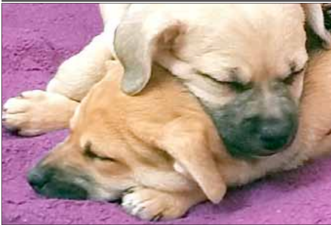
Willkommen im Team

Mika und Motzi, gehören nunmehr zum Personal im „Haus Wilma“. Die beiden Hundedamen erfreuen nicht nur unsere Bewohner. Die Anschaffung der Beiden gehört zu einer Vielzahl von Umstrukturierungen im „Haus Wilma“. Im diesem Jahr möchten wir in unserem Haus eine Begegnungsstätte für Jung und Alt schaffen.