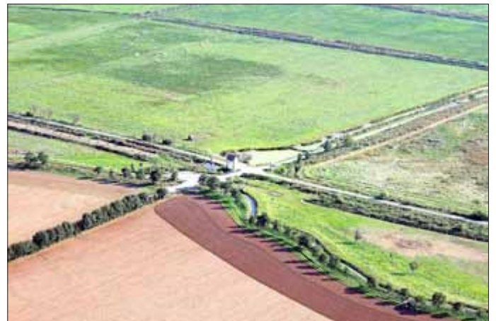
Luftaufnahme über das Ried am Pumpenhaus bei Esperstedt