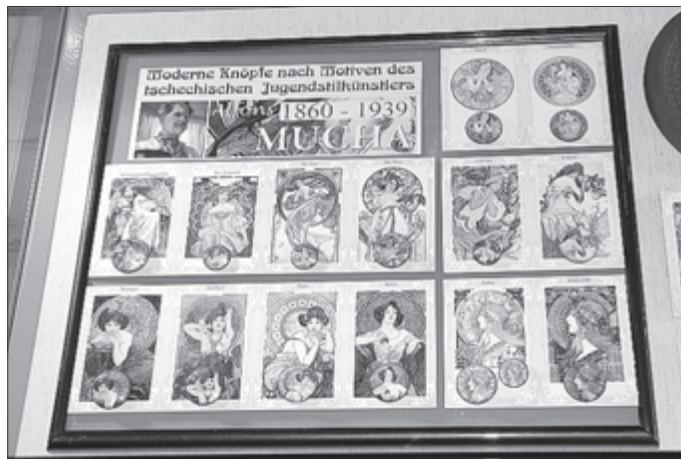
Jugendstilknöpfe aus der Sammlung Voigt

Wer die Ausstellung noch nicht gesehen hat, der sollte sich beeilen. Tausende von großen, kleinen, bunten und glitzernden Knöpfen, gestaltet zu kleinen Kunstwerken, warten auf die Besucher. Manch ein Gast holte sich schon Ideen zur Nachahmung der Knopfbilder. Neben den Kunstwerken aus Knöpfen gibt es einen Exkurs in die Mode. Knöpfe aus verschiedenen Epochen sind zu bewundern. Ausstellungsdauer noch bis 17. Mai 2015