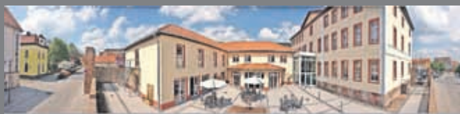
HAUS WILMA - ANGER 1 - 06167 BAD FRANKENHAUSEN - 2015

im Haus Wilma am Anger Anger 1 in Bad Frankenhausen