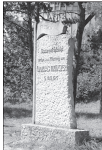
Gedenkstein auf dem Schlachtberg

Wir möchten den 490. Jahrestag zum Anlass nehmen, um unter den Stichworten „Rückblick - Einblick - Ausblick“ über die Erinnerung