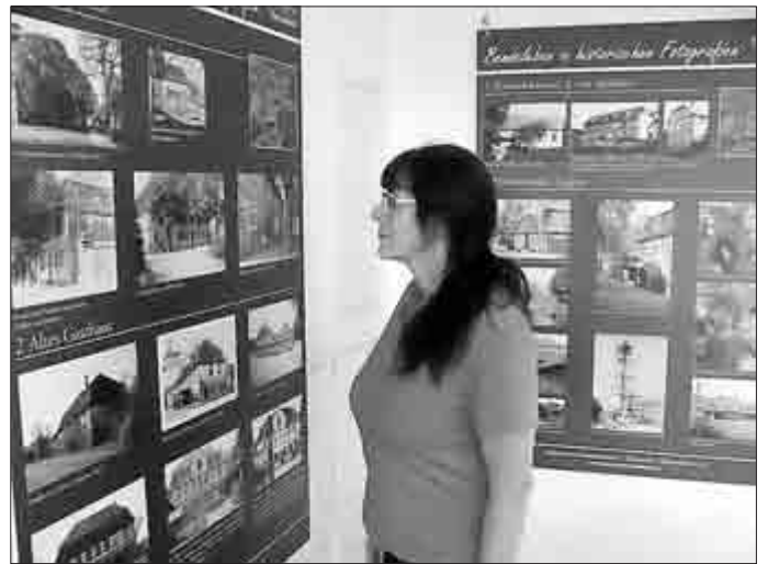
Blick auf die älteste Darstellung von Bendeleben aus dem 18. Jh.

Wer die Presse in der jüngsten Vergangenheit aufmerksam verfolgt hat, dem ist nicht entgangen, dass in unserer Nachbarschaft Bendeleben als ein Außenstandort für die Bundesgartenschau (Buga) 2021 in Erfurt ausgewählt wurde. Bendeleben wird sich insbesondere mit der Orangerie, dem Schlosspark im Stil eines englischen Landschaftsgartens des 18. Jahrhunderts einschließlich Schloss und der Kirche St. Pankratius präsentieren. Das im Dorf schon sehr lange am Erhalt des gesamten Ensembles gearbeitet wurde, macht der Denkmal- und Geschichtsverein „Barockes Bendeleben“ e. V. in seiner im Regionalmuseum präsentierten Sonderausstellung deutlich. In einer eindrucksvollen Schau wird sichtbar, wie der Verfall bedeutender Bausubstanz innerhalb des Dorfes nicht nur aufgehalten wurde, sondern sich bereits Jahre vor der Buga 2021 in einem neuen Glanz zeigt. Anschaulicher als in dieser Sonderausstellung kann momentan kaum gezeigt werden, welche Faktoren dazu führten, dass Bendeleben den so begehrten Zuschlag als Außenstandort erhielt. Ausgehend von der ältesten, bekannten Darstellung von Dorf, Schloss und Park im 18. Jh. werden Entwicklung und Veränderung des Dorfensembles aus Gebäuden und Naturräumen verdeutlicht. Wer einen Eindruck davon gewinnen möchte, wie sich Bendeleben 2021 den erhofften Besuchern der Buga vorstellen wird, bekommt in dieser Ausstellung einen Vorgeschmack.