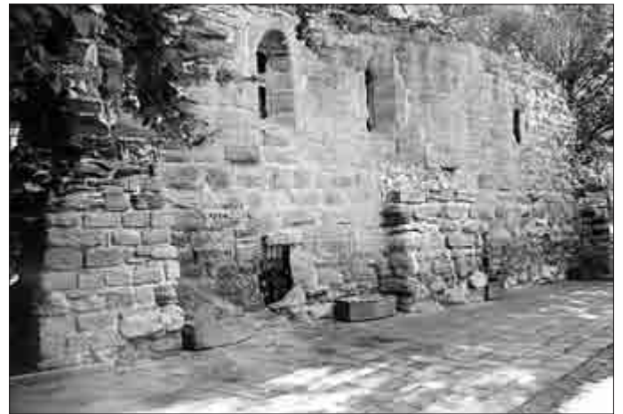
Mauerrest eines ehemaligen Klostergebäudes südlich der Unterkirche

fassenden Umbauarbeiten 1900 bis 1901, nachdem es 1896 zum Sitz des neu eröffneten „Kyffhäuser-Technikum Frankenhausen“ bestimmt worden war.