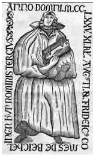
Zeichnung der verschollenen Grabplatte des Grafen Friedrich von Beichlingen

Unbestreitbar ist jedoch, dass die Grafen von Beichlingen - Rothenburg um 1200 in den Besitz der einst zum Reichsgut im nördlichen Thüringen gehörenden Stadt Frankenhausen gelangt sind. Auf ihr Wirken geht der planmäßige Ausbau der Stadt zurück. Etwa an der Stelle des heutigen Stadtschlusses Frankenhausen (Sitz des Regionalmuseums) stand ihre Burganlage, die im Bauernkrieg 1525 erheblich beschädigt und abgetragen wurde. Die Schutzvogtei über das Nonnenkloster hatten sie bis zum endgültigen Verkauf Frankenhausens an die Grafen von Schwarzburg 1340 inne.