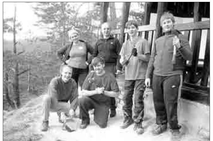
Spaß gab es zur Genüge- Ein Gruppenbild derjenigen, die bis zum Schluss durchgehalten haben