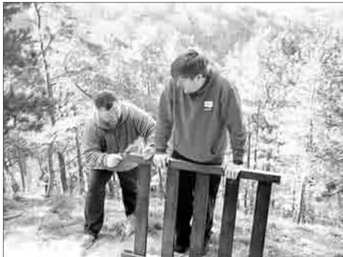
die neuen Geländer werden passend gemacht...

Hier ein paar Bilder vom Einsatz an der Wanderhütte Hornungshöhe. Durch Mitglieder der DLRG OG Kyffhäuser und des CDK Bad Frankenhausen wurden Risse im Putz ausgespachtelt, danach geweißt, die Schnitarbeiten im Gebälk durch die Besucher beseitigt, das Holz neu lasiert und die vom Holzwurm zerfressenen Geländerteile ersetzt. Einige sehr ausgewaschene Wurzeln, die die Eingangsbereiche kreuzten wurden beseitigt und rundherum die Überbleibsel der Zivilisation entfernt. Zum Schluss wurde der Innenraum gereinigt und die Wanderhütte lädt jetzt wieder zum Entspannen und Genießen des fantastischen Blickes durch das Kyffhäuseral ein.