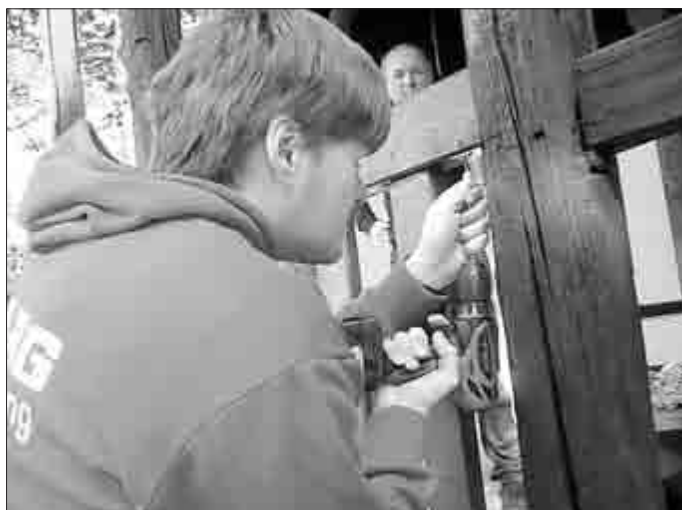
... und eingepasst