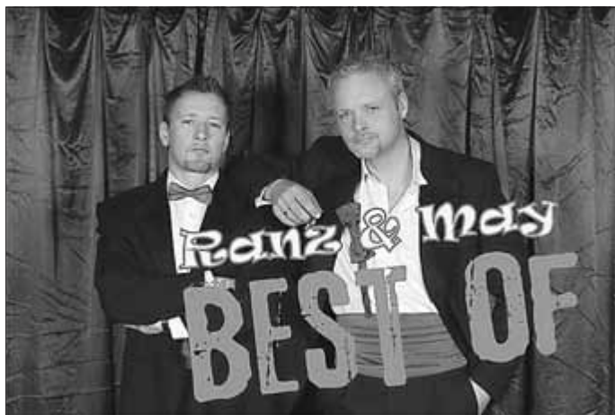
„Best of“ mit und von Ranz & May

Der Vorverkauf findet im Regionalmuseum statt, Tel. 034671/ 6 20 86.