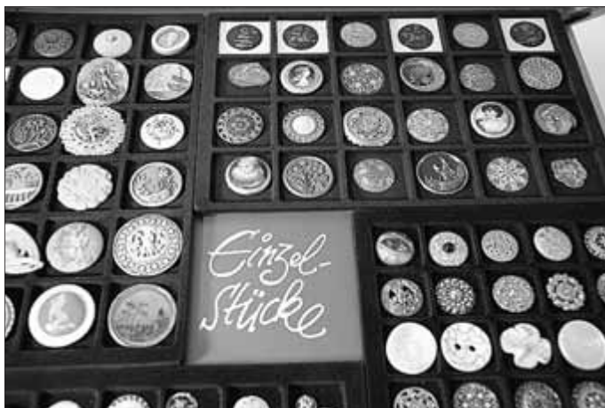
Einzelknöpfe aus verschiedenen Materialien