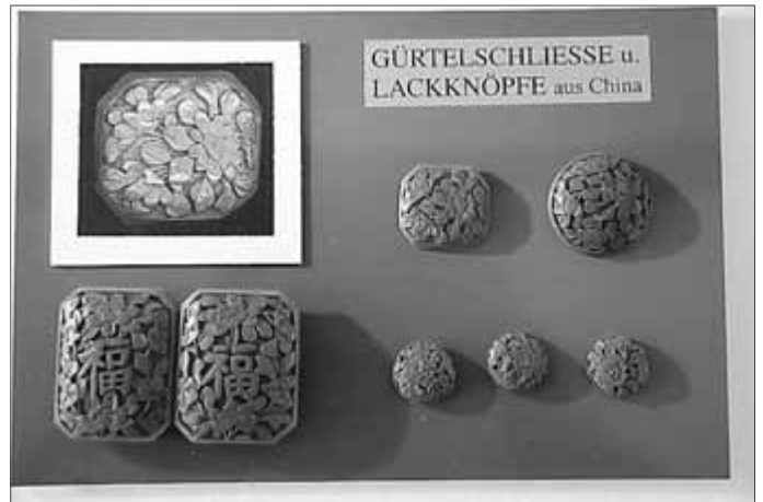
Lackknöpfe und Schließe aus China