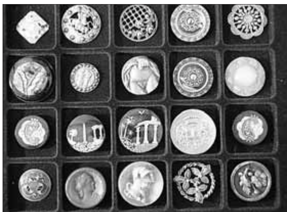
Motivknöpfe unterschiedliche Epochen