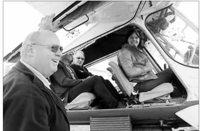
Vor dem Start

Das Wetter stimmte zumindest am Samstag, dem ersten Tag des Anfliegens am Flugplatz Bad Frankenhausen-Udersleben. Strahlender Sonnenschein und eine kühle Brise machten das Fliegen möglich. Während am Vormittag noch emsig Flugzeugflächen poliert, die Segler zusammengesteckt und die Seilwinde abgeschmiert wurden, startete direkt nach dem Mittagessen der erste Segler in die Flugsaison 2015.