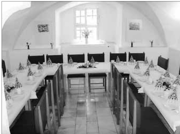
Gewölbe aus dem 16. Jh. im Schloss