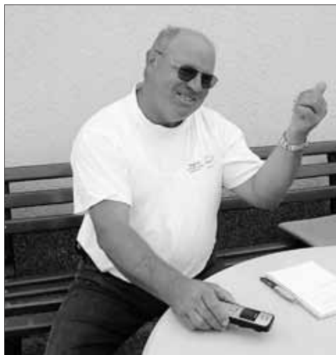
Wenn Alles funktioniert - dann strahlt er