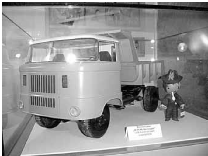
Blick in die Spielzeugausstellung

Nur noch bis zum Sonntag, den 22. Februar 2015, gibt es die Gelegenheit die Sonderausstellung „Spielzeug mal anders - Fahrzeugmodelle, Werbefiguren, Spielzeugwillinge Made in GDR“ zu besichtigen.