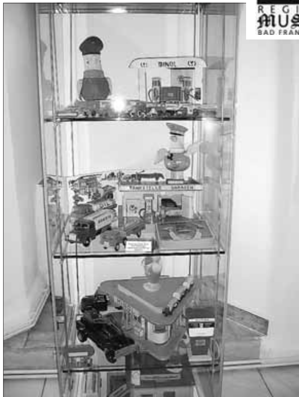
Minolpirol und Co.

Nur noch bis zum Sonntag, den 22. Februar 2015, gibt es die Gelegenheit die Sonderausstellung „Spielzeug mal anders - Fahrzeugmodelle, Werbefiguren, Spielzeugwillinge Made in GDR“ zu besichtigen.