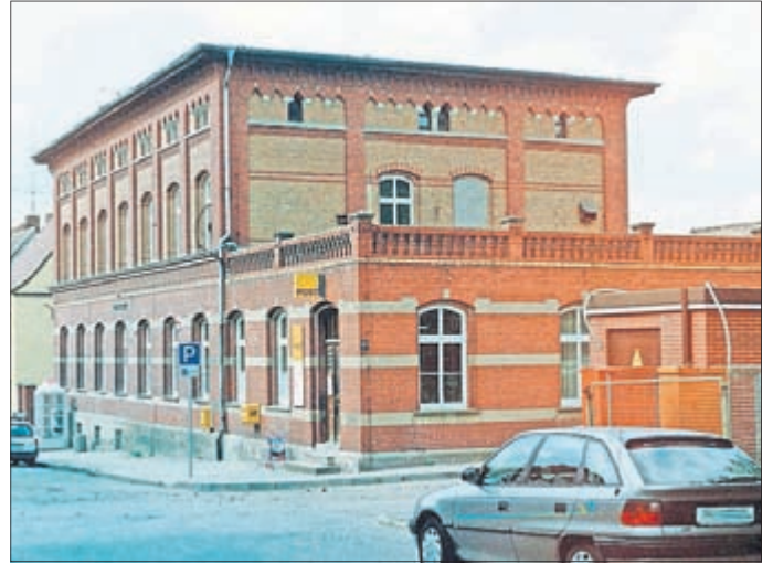
Das ehemalige Postamt in der Poststraße