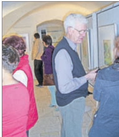
Besucher im Gespräch