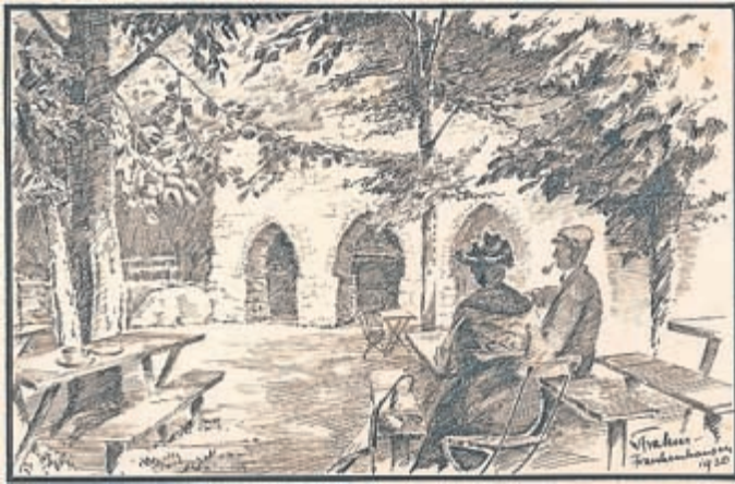
Die Arensburg bei Seega, W. Frahm, 1920