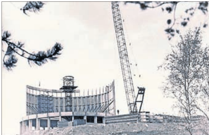
Bau des Panoramamuseums, Aufnahme 1974