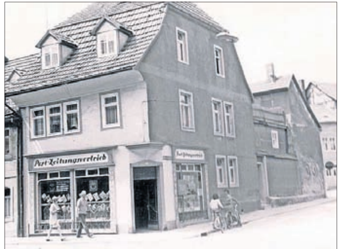
Ehemaliges Post-Zeitungsvertriebsgeschäft in der Kräme