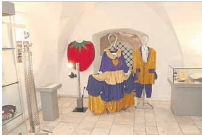
Kostüme des FKK Wipperveilchen