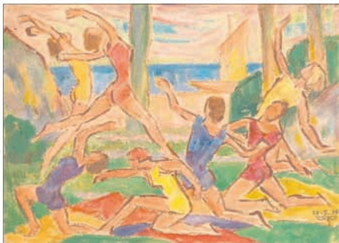
W. Frahm, Gymnastikgruppe 1935