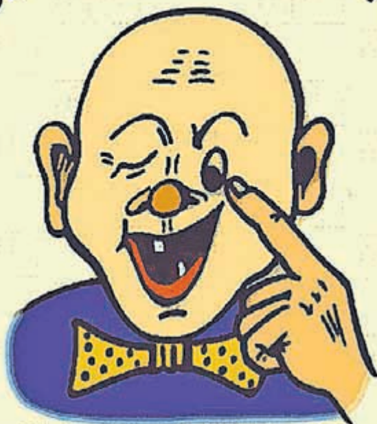
„Solzkopp“ von Fritz Wallrodt, 1955