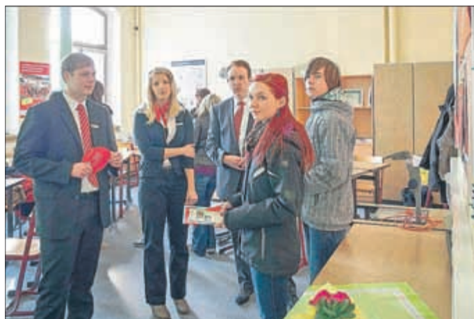
Im Bild informieren Bankkaufleute im 2. Ausbildungsjahr Schulabgänger der 10. Klasse.

Wer sich den Programmablauf interessiert oder eine individuelle Beratung wünscht, erreicht den Schulteil1 unter: Tel. 03632 59733 und den Schulteil 2 unter: Tel. 03632 52290 oder findet Informationen im Internet unter www.sbz-sondershausen.de