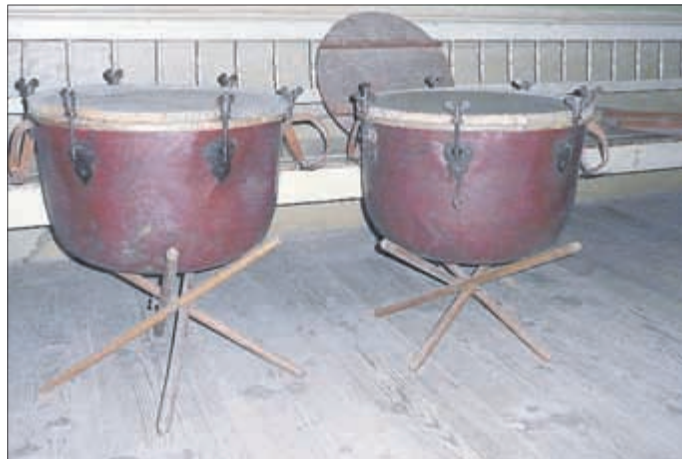
Das historische Paukenpaar am ursprünglichen Standort in der Unterkirche zu Bad Frankenhausen