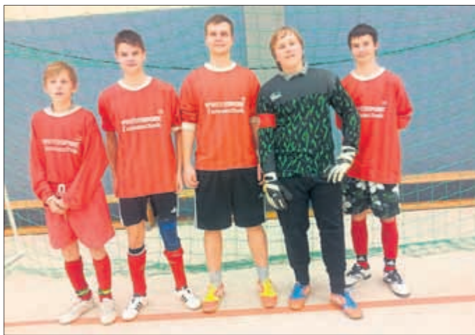
Platz 2 „Die Rottleber Stars“