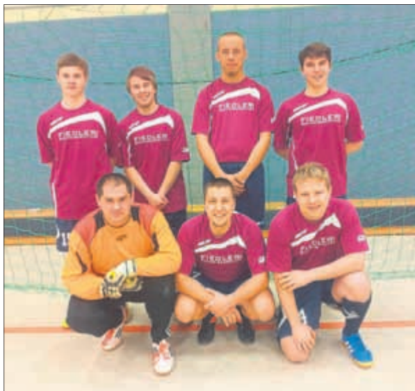
3. Platz SV 58 Esperstedt