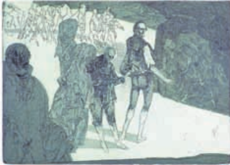
H 9 Trompeten, König Heinrich, Lords und Gefolge, 2000 Radierung, 25 x 35 cm Besitz des Künstlers

Am 01. März 2014 eröffnete das Panorama Museum die Exposition „Robert Schmiedel - Landschaften, Historien, Capricci“, die etwa 130 Arbeiten des Leipziger Grafikers präsentiert.