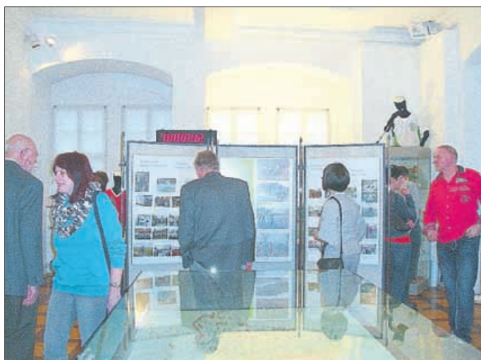
Blick in die Sonderausstellung zum Kyffhäuserberglauf