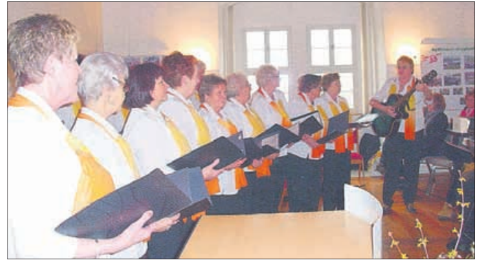
Auftritt des Frankenhäuser Frauenchores