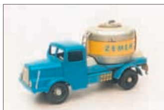
Aus der Sammlung Frank Lange

Seit vielen Jahren sammelt auch Frank Lange Spielzeug „Made in GDR“. Immer wieder faszinierten ihn die Vielfalt und der Ideenreichtum dieser Spielzeuge.