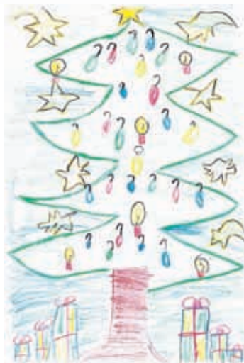
Grafik Felicia Rinck (6)

Findet am Freitag, 07. Dezember 2012 ab 16:00 Uhr hinter den Toren des „Wippergärtchen“ Bad Frankenhausen statt.