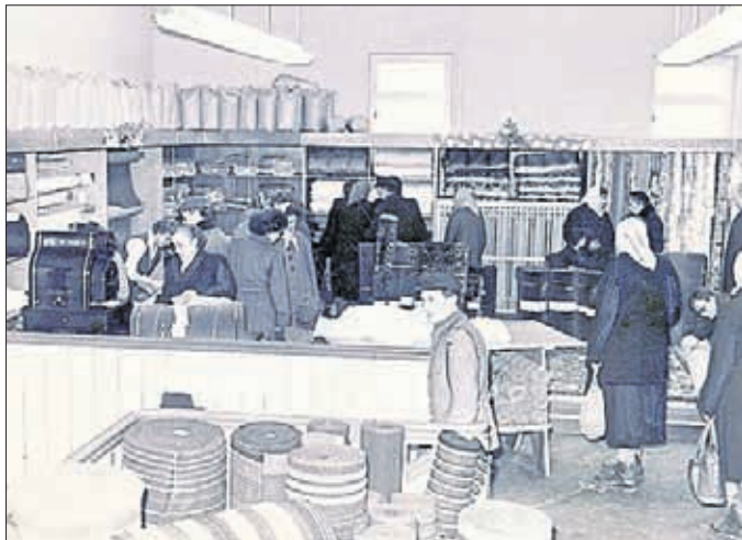
Kaufhaus in der Klosterstraße, Bad Frankenhausen

Dass die Ausstellung so reichhaltig mit Gegenständen aus dem Lebensalltag der Jahre 1952 bis 1994 ausgestattet werden konnte, verdanken wir mehr als zwei Dutzend Leihgebern aus dem gesamten Altkreisgebiet. Ihnen gilt an dieser Stelle ein ganz besonderes Dankeschön.