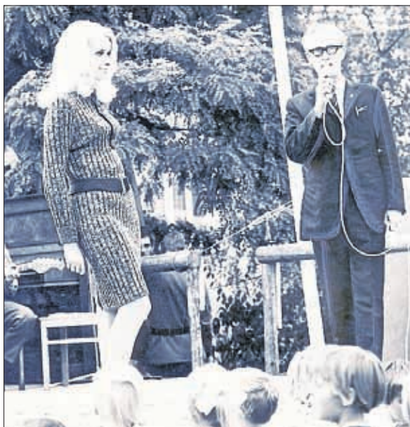
Modenschau VEB Strickmoden