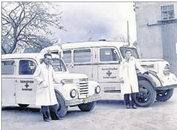
Krankentransport des DRK