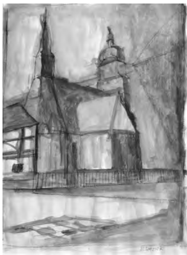
Architekturstudie von der Benedebener Kirche von Bettina Lotzwik

Jenseits der Kino- und Konzertveranstaltungen, beschäftigte ich mich momentan intensiv mit den verschiedenen Kursen. Der Kinderkurs zeichnet momentan die Oberkirche und allein die barocke Doppelturmhäube ist eine Herausforderung der zeichnenden Kinderhand. Der Erwachsenenkurs absolviert hingegen gerade verschiedene Experimente und komponiert absonderlichste Gegenstände zu Stilleben, die entsprechend bestimmter inhaltlicher Vorgaben umarrangiert werden müssen. Dadurch sollen den Teilnehmern Figur-Formatbeziehungen, Farblänge und deren Ausdruckswerte vermittelt werden.