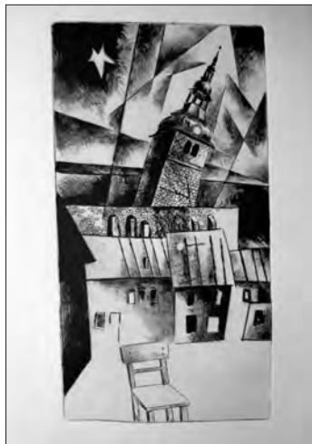
Foto mit der Radierung „Leerer Stuhl“; Rechteinhaber: Fred Böhme / VG Bildkunst Bonn

Was soll die Kunst in den Ateliers oder in Mappen schlummern? Ist es da nicht besser, wenn sie ihrem Adressaten auch an ungewöhnlichen Orten auflauert und nicht wartet, bis einer von ihnen den Weg in die einschlägigen Ausstellungen findet?