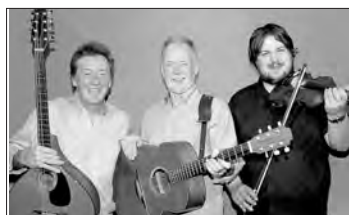
Rechteinhaber: North Sea Gas 8. April, 20:00 Uhr in der Eingangshalle Eintritt: VVK 10,- EUR / AK 12,- EUR

Das dabei wirklich gelungene Arbeiten entstehen können, soll eine Ausstellung mit Kursresultaten belegen, die ich plane und deren Vorbereitung mich momentan ziemlich beansprucht. Fred Böhme