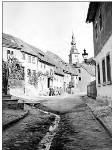
Offener Kanal in der Wasser-gasse 1910