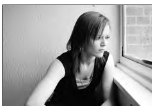
15. April, 20:00 Uhr im StuKi 76 Drama Fish Tank (GB 2009) Regie/Buch: Andrea Arnold D.: Michael Fassbender, Harry Treadaway, Kierston Wareing, Katie Jarvis, Charlotte Collins u.a.

Weitere Infos/Hörproben etc. unter: http://nsg.gplrank.info/ Eintritt: Vorverkauf (an der Panorama-Kasse bzw. am Mittwoch, dem 6. April zwischen 16:30 und 17:30 Uhr in der REHA-Klinik Bad Frankenhausen) 10,- EUR, Abendkasse 12,- EUR, weitere Informationen / Reservierungswünsche über Fred Böhme, Tel.: 034671-6190 oder E-Mail: fred-boehme@t-online.de ; mit Shuttle-service durch Taxiunion Tel.: 0800-3023666 , Abfahrt ab REHA-Klinik 19:00 Uhr, nach Konzertende ca. 22:30 Uhr zurück. Interessenten melden sich bitte vorher an, REHA-Patienten tragen sich bitte in die Liste im Patientenordner ein!