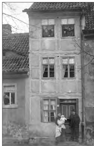
Siebenköpfige Familie in Jungfernstieg 8

Die umfangreichen Planungen zur Erweiterung der Stadt Frankenhausen brachten es mit sich, dass über die Einführung einer Verordnung zur Anbringung von Hausnummern entschieden werden musste. Bislang gab es eine unendliche Zahl an Nummerierungen, bis hin zu jeder Untervermietung eines Zimmers. Nunmehr erhielt jedes Haus eine einzige Nummer. Eigentlich sollten die Hauseigentümer die Kosten für Anschaffung und Anbringung selbst tragen. Doch zum Entsetzen der fürstlichen Finanzbehörde machten die beiden Stadtratsfraktionen samt Bürgermeister den Bürgern ein „Geschenk“. Ein städtischer Mitarbeiter des Bauhofs lieferte die vergebene Hausnummer und brachte sie persönlich an der gewünschten Stelle an. Fast alle der damals vergebenen Nummern besitzen heute noch ihre Gültigkeit. Ebenso bestand nun die allgemeine Verpflichtung, jede Straße ein- und ausgangs mit einem Straßennamenschild zu versehen.