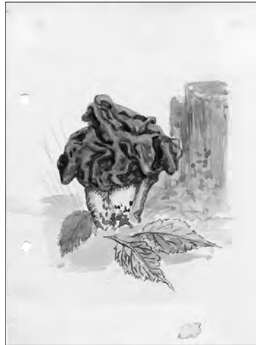
Die „Kyffhäuserlorchel“ Aquarell Kurt Engelmann 1964

Zu diesem Vortrag laden wie immer Heimat- und Museumsverein und Regionalmuseum gemeinsam ein.