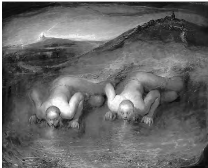
Dust Lickers, 2000 - Oil on canvas - 203 x 270 cm - The Nerdrum Institute, Disenå

Die Ausstellung, die in Kooperation mit dem Nerdrum Institut, Disenå/Norwegen ( www.nerdruminstitute.com ) entstand, präsentiert erstmals in einem deutschen Museum knapp 40 überwiegend großformatige Gemälde von Odd Nerdrum (geb. 1944) aus mehr als 30 Schaffensjahren.