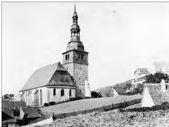
Oberkirche von der Friedhofsmauer aus gesehen

Die Räume sind mit einer vollständigen Küche, Geschirr und Platz für ca. 30-35 Personen hervorragend für Feierlichkeiten im historischen Ambiente des Frankenhäuser Schlosses geeignet. Natürlich können bei entsprechender Witterung auch die angrenzenden Terrassenbereiche in