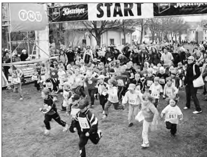
Start der Bambini zur Runde um das Schloss

und im Geschichtsbuch zu dieser 1. Großveranstaltung des Jahres 2010 in unserer Stadt ist fast ausschließlich Positives zu lesen.