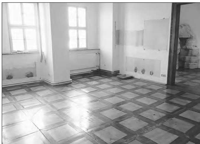
Derzeit sehen die Räume kur vor der Sanierung

Zusammen mit den Fachleuten des Thüringischen Landesamtes für Archäologie und Denkmalpflege in Weimar wird der wissenschaftliche Grundstock für die neue ständige Ausstellung erarbeitet.