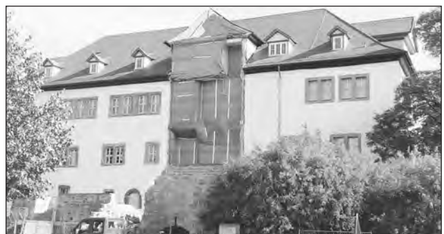
Aktuelle Ansicht vom 5. Oktober 2009

Die monatlichen Vorträge finden, trotz Schließung, im Festsaal des Frankenhäuser Schlosses statt.