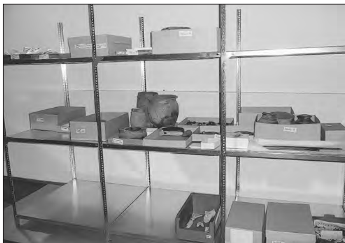
Zusammenstellung der Objekte für die neue ständige Ausstellung

Zusammen mit den Fachleuten des Thüringischen Landesamtes für Archäologie und Denkmalpflege in Weimar wird der wissenschaftliche Grundstock für die neue ständige Ausstellung erarbeitet.