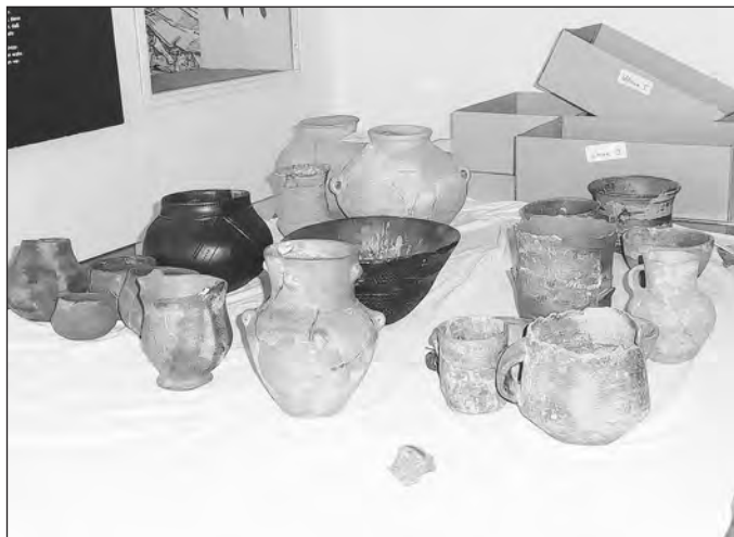
Zusammenstellung der Objekte für die neue ständige Ausstellung

Während die Bauarbeiten am Mittelrisalit des Frankenhäuser Schlosses fortschreiten, wird im Inneren, in der Ausstellungsetage im 2. Obergeschoss, fleißig an der Umgestaltung der ständigen Ausstellung zur Ur- und Frühgeschichte gewirkt.